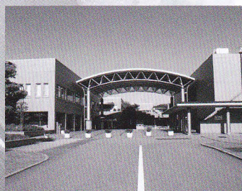
① 研修会会場 『七尾サンライフプラザ 中ホール』 TEL.0767-53-1160