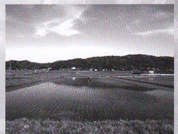
③ 現地見学会場 『中能登町 田中良夫氏水田』